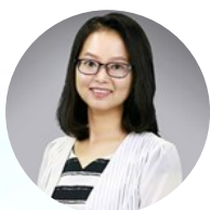
鄢霞教授 北京师范大学